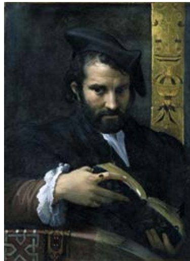
Πορτρέτο ενός άνδρα με ένα βιβλίο- Parmigianino https://antikleidi.com/2015/03/03/pinakesbiblionia/