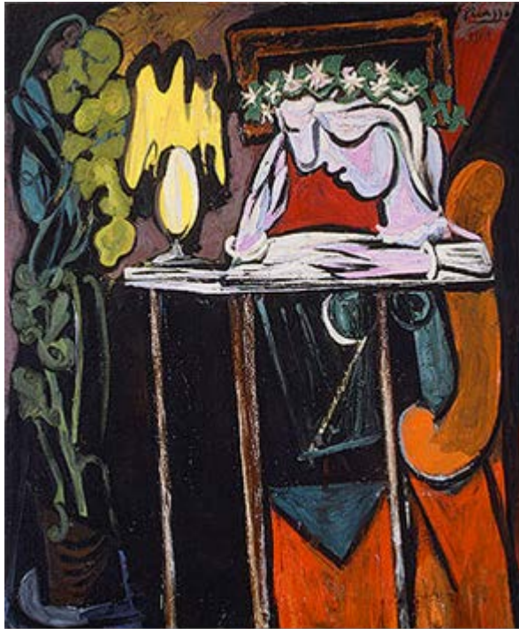
Π. Πικάσσο, Διαβάζοντας στο τραπέζι. 1934. Βρίσκεται στο Μητροπολιτικό Μουσείο Τέχνης στη Ν.Υόρκη (Metropolitan Museum of Art. New York).