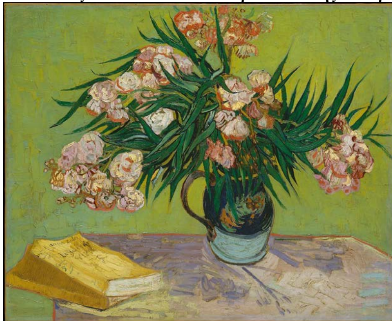
Oleanders, 1888 by Vincent Van Gogh [πικροδάφνες]

[Ο 2ος πίνακας = από το Μουσείο Μετροπόλιταν της Ν. Υόρκης]