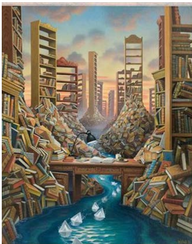
Η κοιλάδα από μελάνι – Jacek Yerka 2012 https://antikleidi.com/2015/03/03/pinakesbibliona/