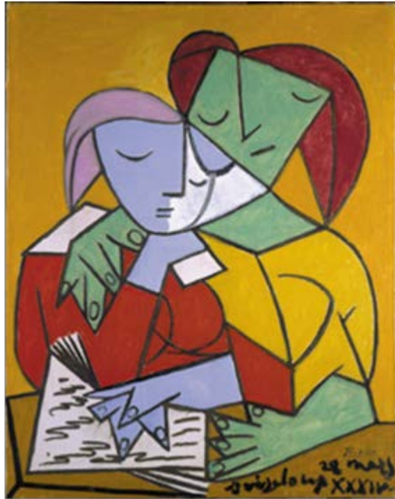
Π. Πικάσσο, δύο κορίτσια που διαβάζουν . 1934. Βρίσκεται στο Μουσείο Τέχνης του Πανεπιστημίου του Michigan (University Michigan Museum of Art).