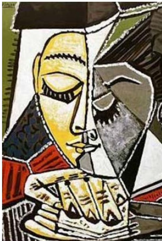
Π. Πικάσσο, Κεφάλι γυναίκας που διαβάζει. 1906