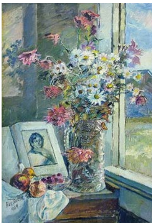
Βάζο με λουλούδια κι ένα βιβλίο δίπλα στο παράθυρο – David Burliuk 1954 https://antikleidi.com/2015/03/03/pinakesbiblion/