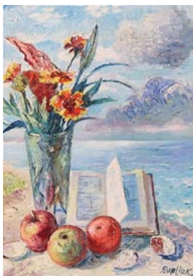
Το βιβλίο της θάλασσας David Burliuk https://antikleidi.com/2015/03/03/pinakesbiblion/