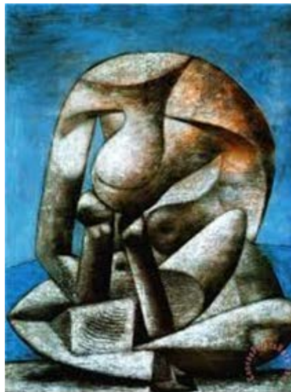
Π. Πικάσσο, The reading woman 1937

Βλ. πίνακες «φιλιαναγνωσίας» του Πικάσο: https://anthologio.wordpress.com/2017/07/16/%CE%AC-%CE%AC-%CE%AF-%CE%AC/