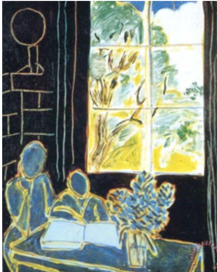
Henri Matisse, The silence that lives in houses , 1947, 61 x 51 cm, Private Collection