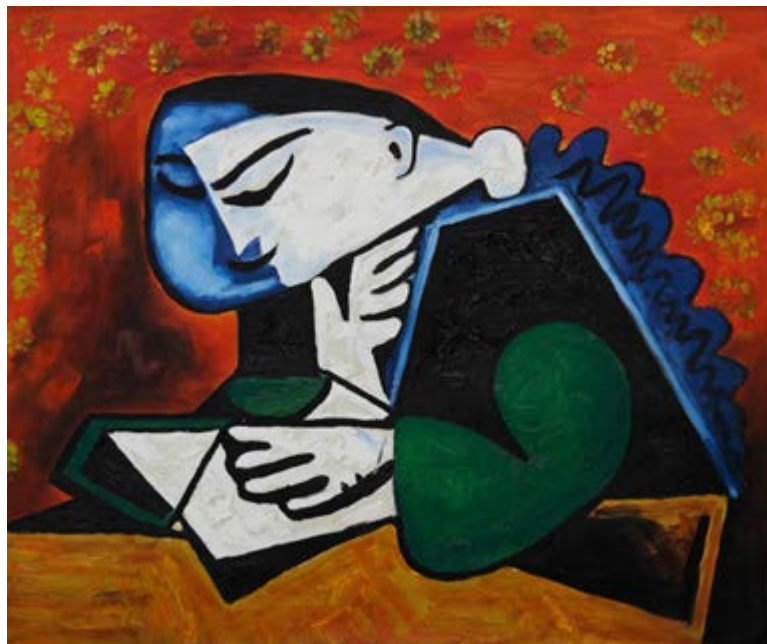
Πάμπλο Πικάσσο: Η ανάγνωση , 1953