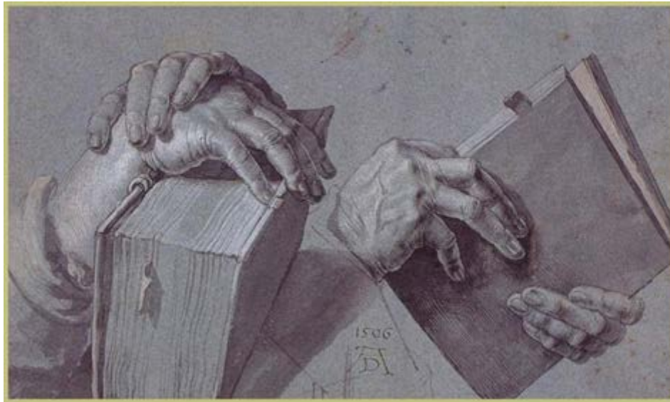
Δυο χέρια που κρατούν ένα ζευγάρι βιβλία -Albrecht Durer https://antikleidi.com/2015/03/03/pinakesbibliona/ -----