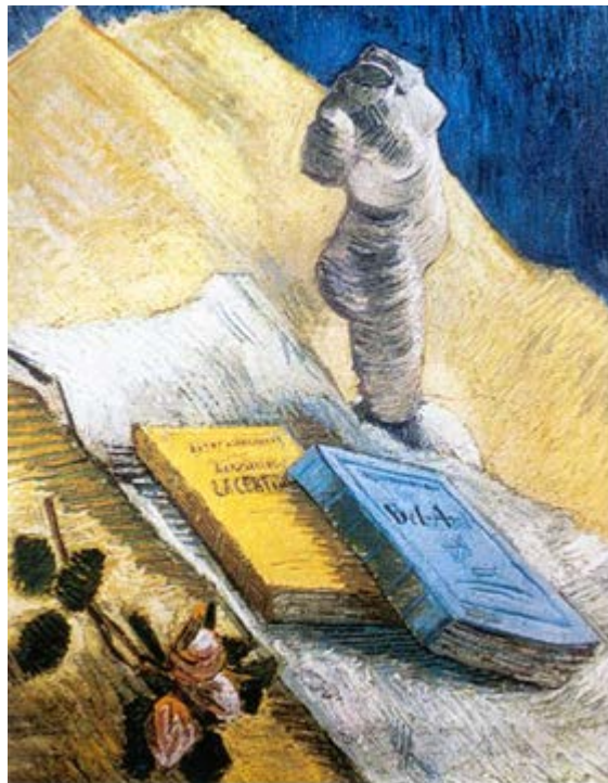
Νεκρή φύση με γύψινο αγαματίδιο, ένα τριαντάφυλλο και δύο μυθιστορήματα Vincent van Gogh 1887 https://antikleidi.com/2015/03/03/pinakesbibliona/ -----