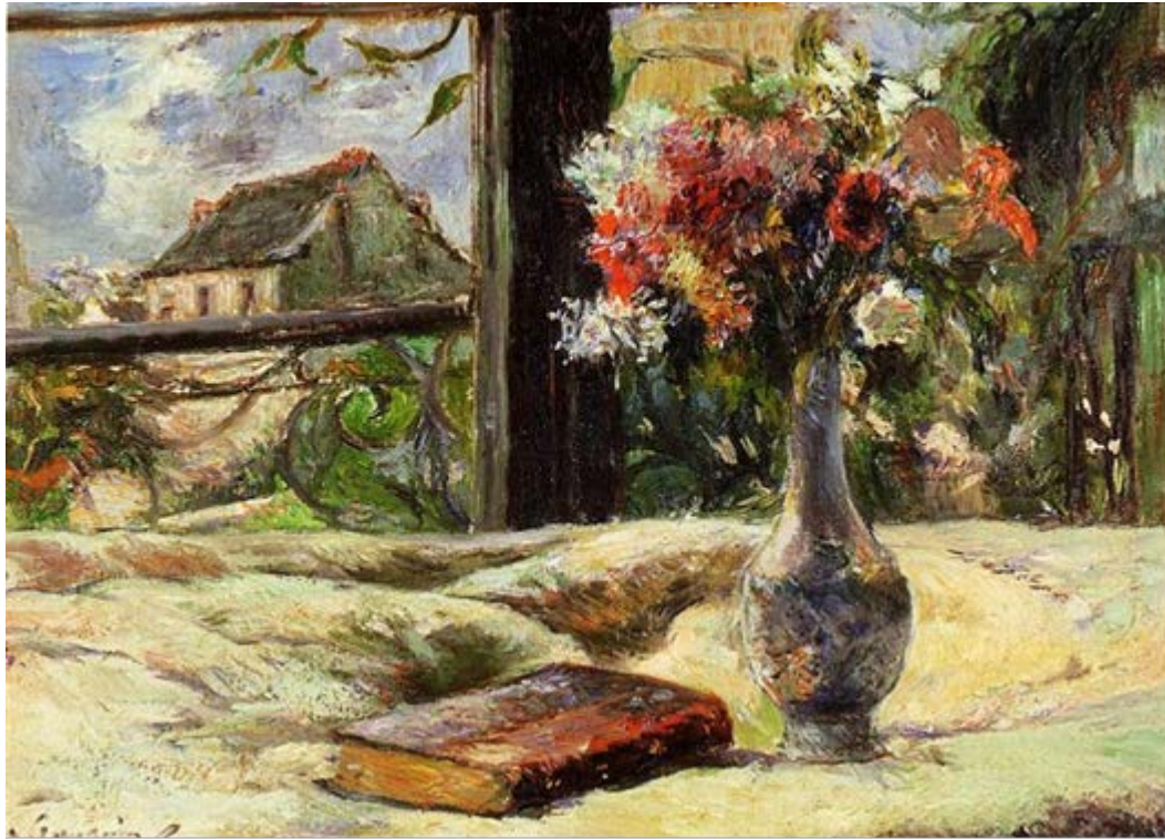
Βάζο με λουλούδια στο παράθυρο. Paul Gauguin 1881 https://antikleidi.com/2015/03/03/pinakesbiblionia/