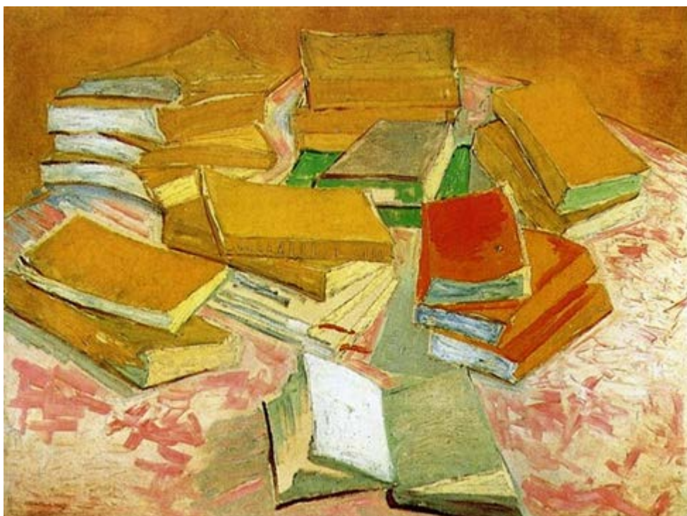
Νεκρή Φύση – Γαλλικά Μυθιστορήματα - Vincent van Gogh 1888 https://antikleidi.com/2015/03/03/pinakesbibliona/