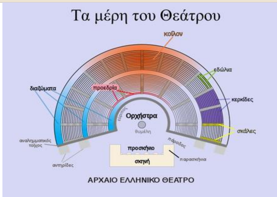
Εικόνα 3: Αρχαίο ελληνικό θέατρο

Επιλέγεται να μελετήσουν οι μαθητές ένα θέατρο που βρίσκεται εγγύτερα στη σχολική μονάδα ή που αποφάσισαν κατά πλειοψηφία ότι θα ήθελαν πολύ να το γνωρίσουν καλύτερα, πατώντας στο σύνδεσμο: http://ancienttheater.culture.gr/el/ekpaideftikoyliko/entupa/--17 .