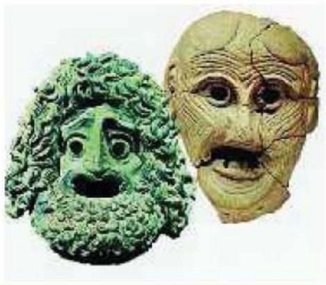
Εικόνα 1: Μάσκες αρχαίου θεάτρου